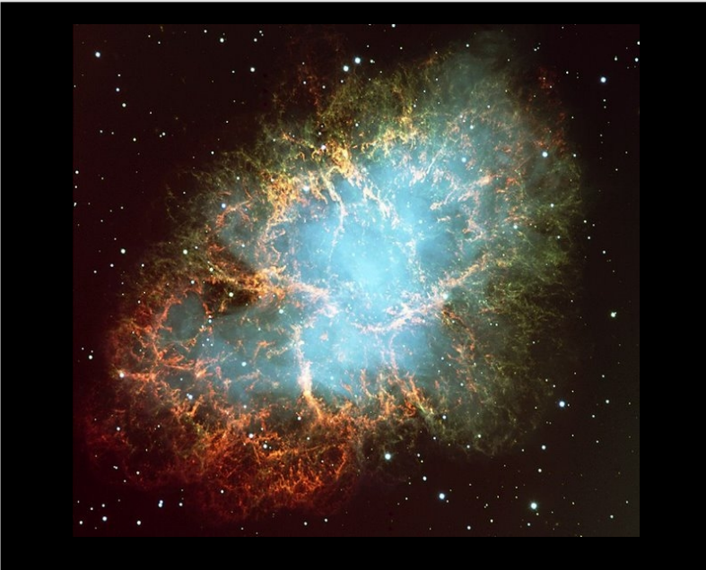
Imagen : Nebulosa del cangrejo