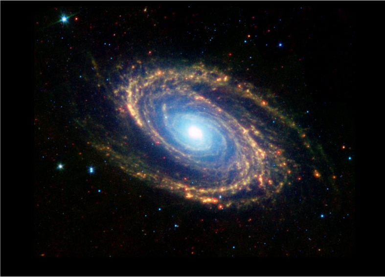
Imagen : Galaxia espiral